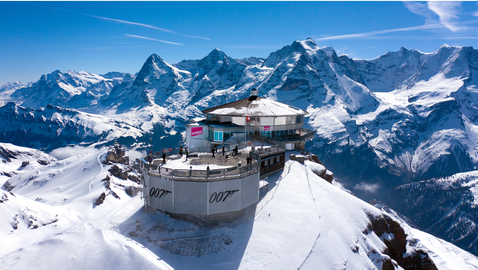
Schilthorn Piz Gloria 2790 m