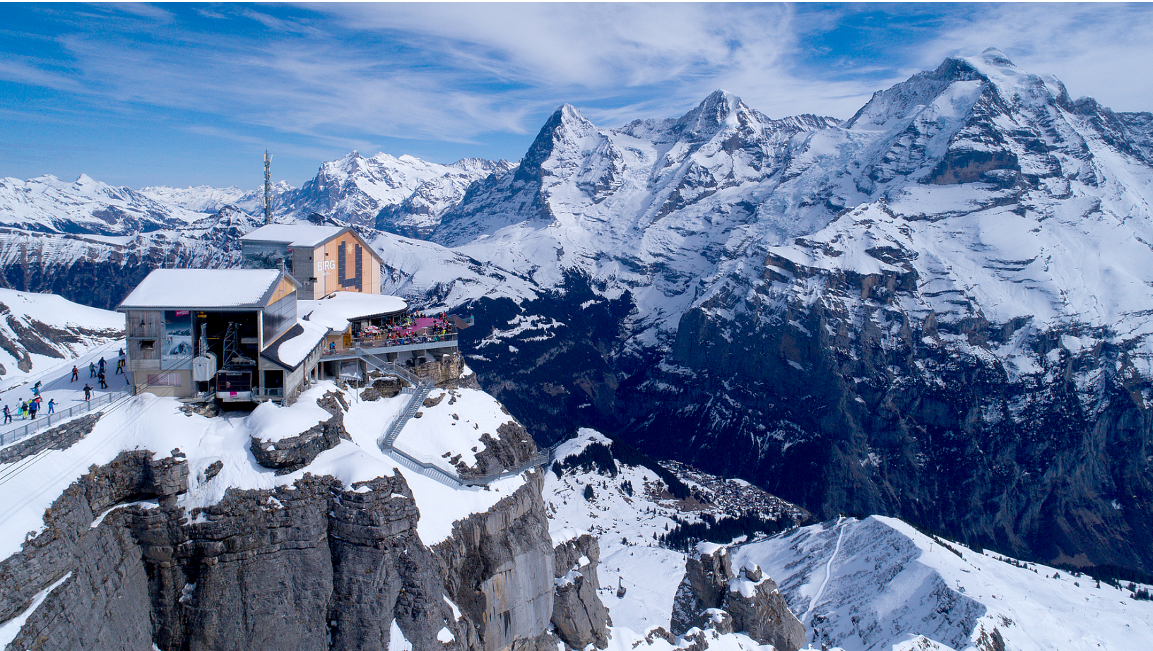
Drohnenaufnahme der Station Birg mit Eiger, Mönch und Jungfrau im Hintergrund